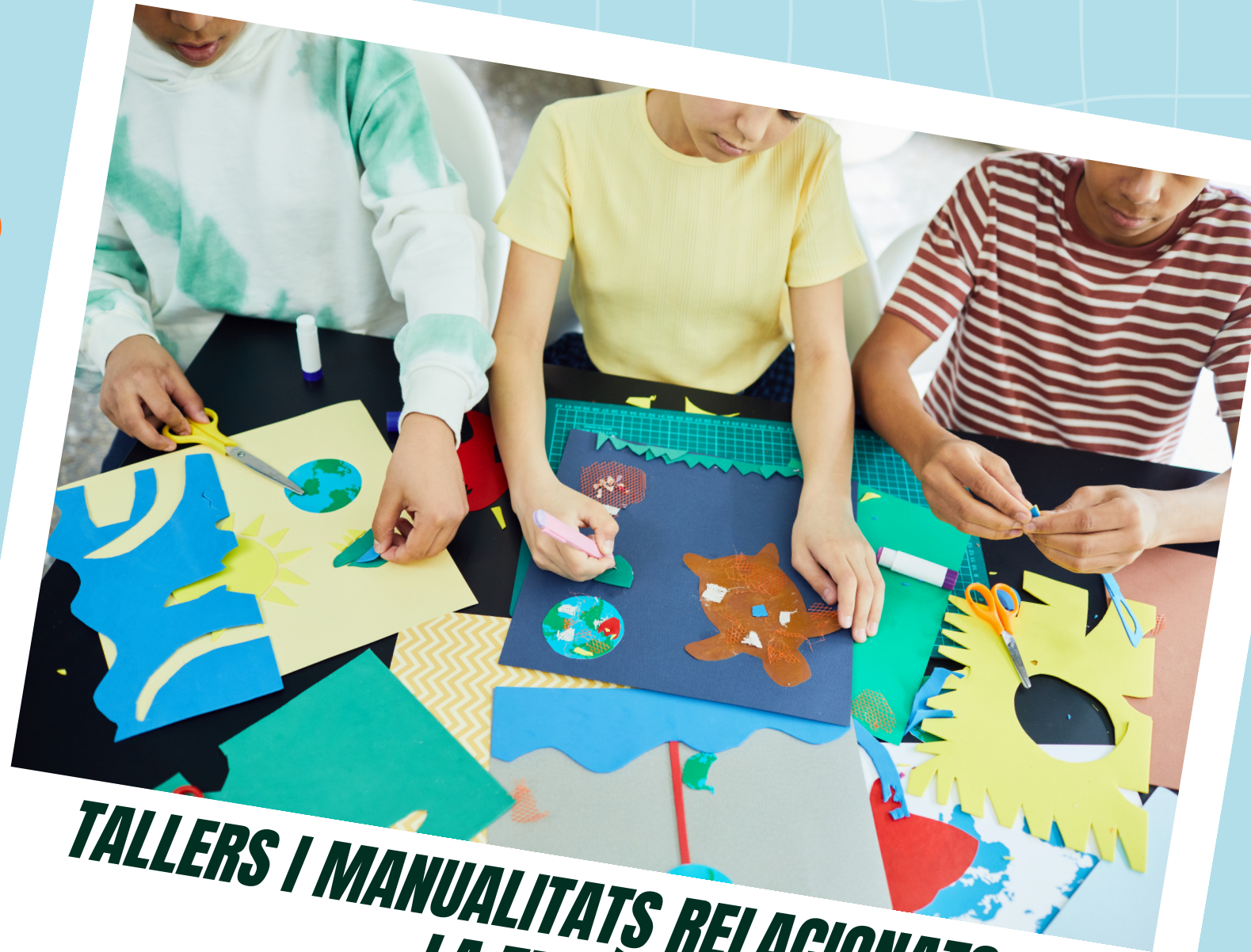
TALLERS I MANUALITATS RELACIONATS AMB LA TEMÀTICA