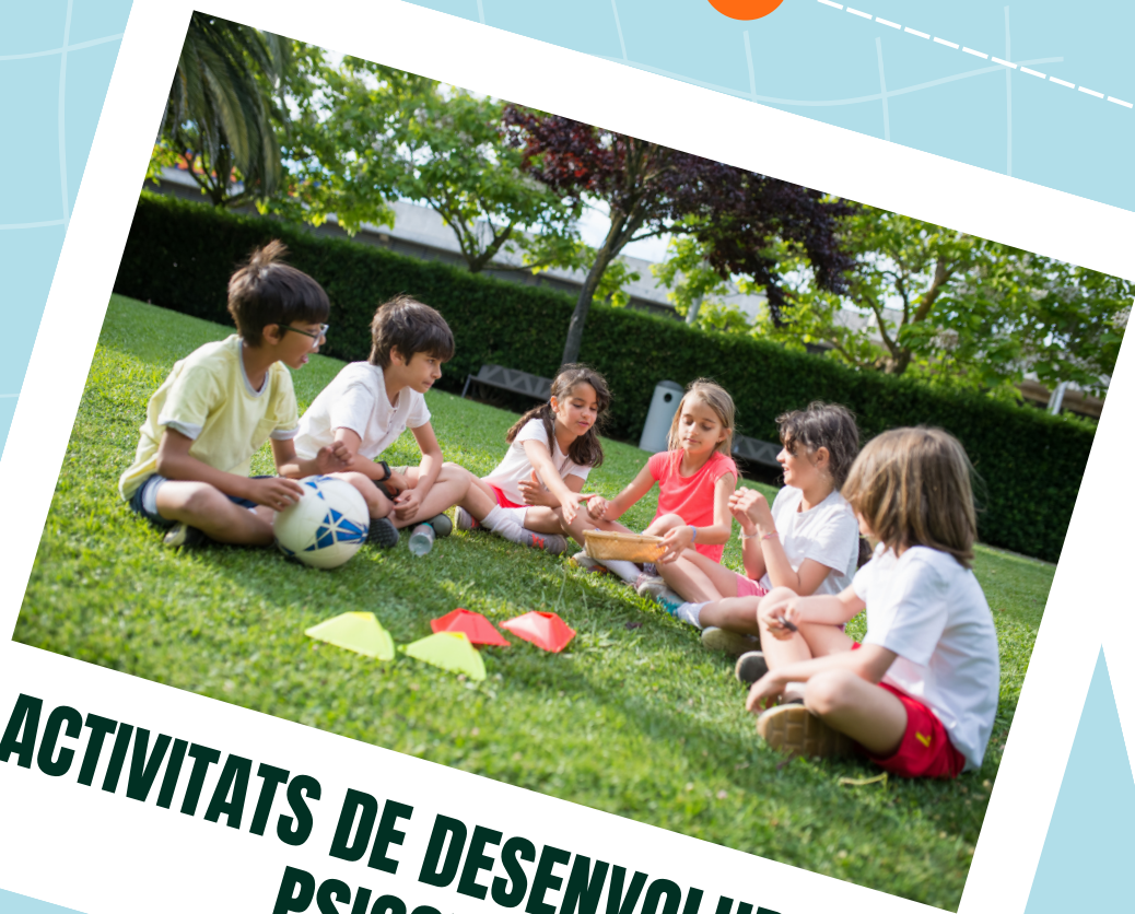
ACTIVITATS DE DESENVOLUPAMENT PSICOMOTRIU